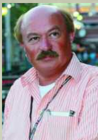
Autor Hermann J. Huber

Auch das Thema Aids wird auf Gran Canaria nicht vergessen. In der traditionellen Donnerstagshow während des Gaypride steigt eine große Benefizgala. Am Ende tragen die Besucher rote Lichter zur Erinnerung an die Verstorbenen in den "Garten der Erinnerung".